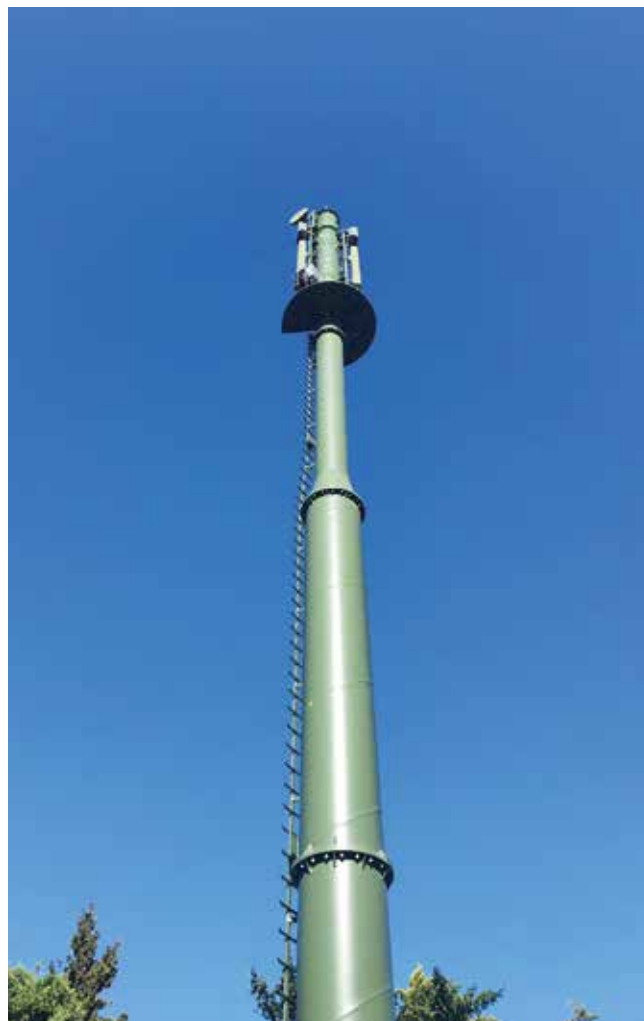
Photo d'illustration d'une antenne 5G monotube.

Même si l'on peut toutes et tous regretter le choix de ce site, ce qu'il est essentiel de rappeler au sujet de ce projet, c'est qu'il est présenté en conformité avec les lois et règlements en vigueur dans notre pays et que la mairie se doit de les respecter . En outre, la jurisprudence nous montre qu'en droit il n'y a pas d'argument recevable pour s'y opposer. Si la commune voulait faire ce choix, au mieux ce projet serait retardé mais se ferait quand même et elle aurait à régler les frais liés au passage de