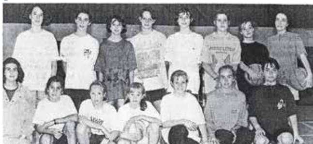
Les équipes benjamines et minimes à l'automne 1993.

Si vous avez des photos (entre autres des années 1993-2010 avant la généralisation des smartphones), des vidéos... faites les parvenir à l'une de ces adresses : elvire.orty@orange.fr - mledantec@wanadoo.fr - eric.schwartz@orange.fr - asplomelinbasket@gmail.com