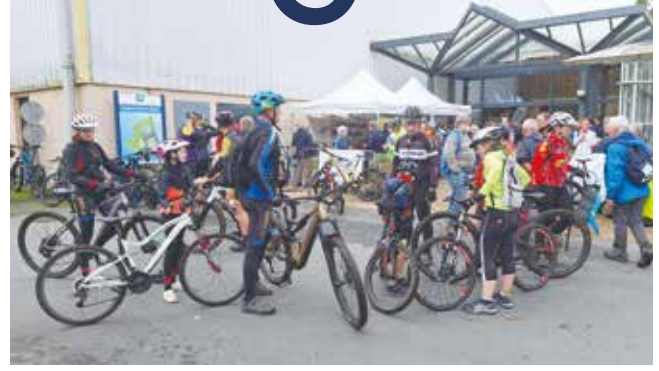
Les vététistes de la 10 e Randoligo ont été nombreux à parcourir les circuits qui leur étaient proposés.