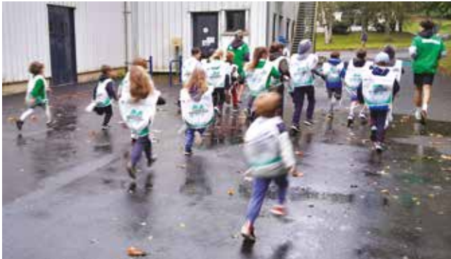
La pluie n'a pas découragé les coureurs des Virades, petits et grands.