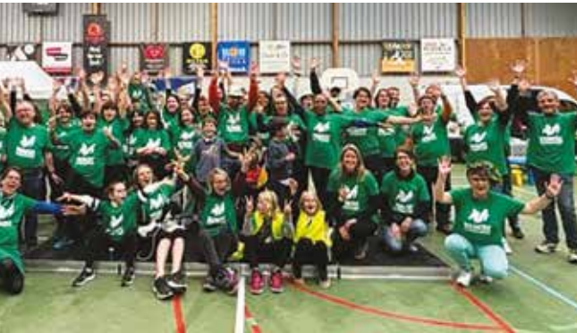
Des bénévoles heureux à l'issue des 2 e Virades de l'espoir de Plomelin.