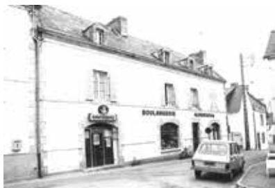
La boulangerie Forlay, au milieu des années 1970.