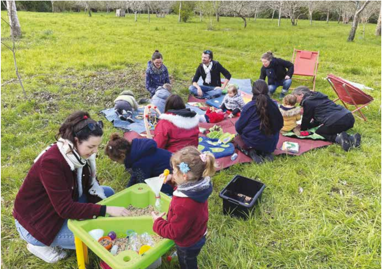
À chaque saison, le secteur environnement et familles de l'ULAMIR organise un atelier nature gratuit pour les enfants jusqu'à 3 ans au verger communal de Pen Allée (à lire en page 9).