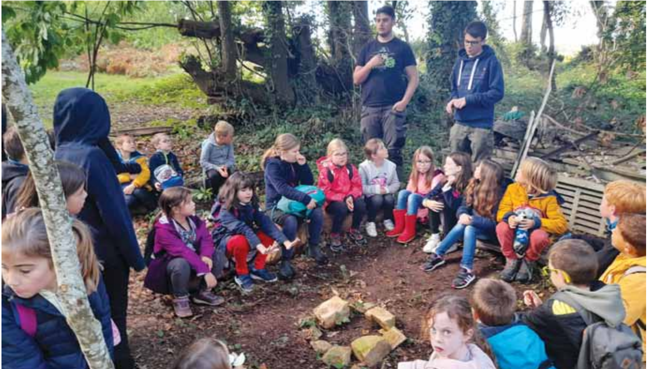
Encadrés par des lycées de Kerbernez, les enfants du centre de loisirs ont appris à construire des cabanes, découvert les araignées et les batraciens, joué à cache-cache... voir l'article en page 6.