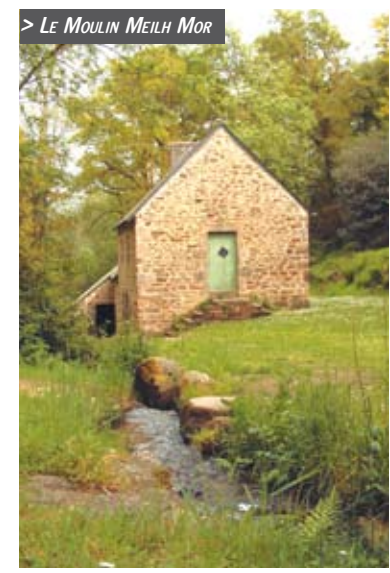
> LE MOULIN MEILH MOR

Plomelin, riche de terre fertile attire très tôt une population nombreuse dont on voit encore aujourd'hui les vestiges : menhirs de Pont Menhir, tumulus de Lezourmel. L'évolution de Plomelin au cours de l'histoire est lente.