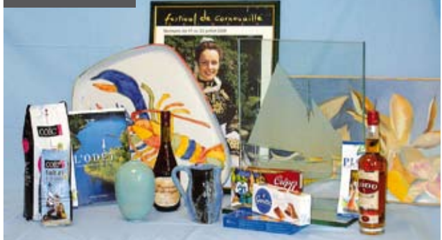
> SPÉCIALTÉS CULINAIRES

Impossible de venir à Plomelin sans goûter au fameux Eddu, whisky au blé noir unique au monde produit par la Distillerie des Menhirs. Vous pouvez aussi déguster les cafés Coic dont la réputation déborde largement les limites de la commune. Au bourg, une boulangerie-pâtisserie de qualité et plusieurs commerces vous accueilleront, complétés par le marché du dimanche matin (crêpes à emporter, charcuterie artisanale...)