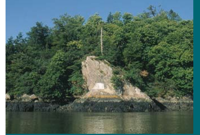
> LE ROCHER DE LA PUCELLE