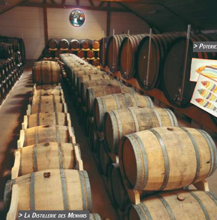
> LA DISTILLERIE DES MENHIRS