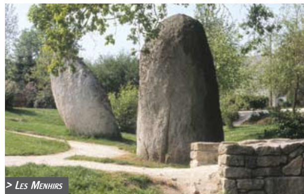
> LES MENHIRS

Plomelin est riche d'un patrimoine historique et religieux. Témoins de l'époque du néolithique, les menhirs sont les traces les plus anciennes laissées par l'homme au cœur du bourg. D'autres vestiges anciens se trouvent aussi au Gorré Bodivit : une villa et des thermes gallo-romains.