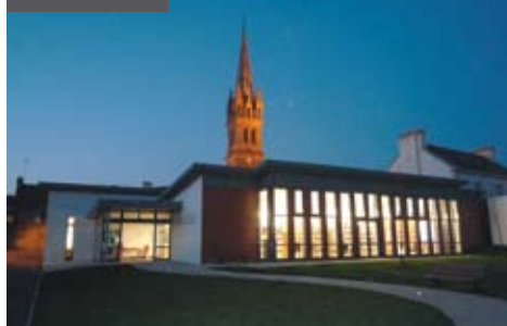
> LA MÉDIATHÈQUE

Découvrez toutes les communes de Quimper Communauté :