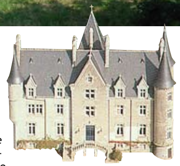
> LE CHÂTEAU DE KERAMBLEIZ

Les premiers grands changements arrivent au XX e siècle avec la modernisation de l'agriculture et l'élévation du niveau de vie. Plomelin profite de sa situation privilégiée à l'ouest de Quimper pour attirer une population y travaillant.