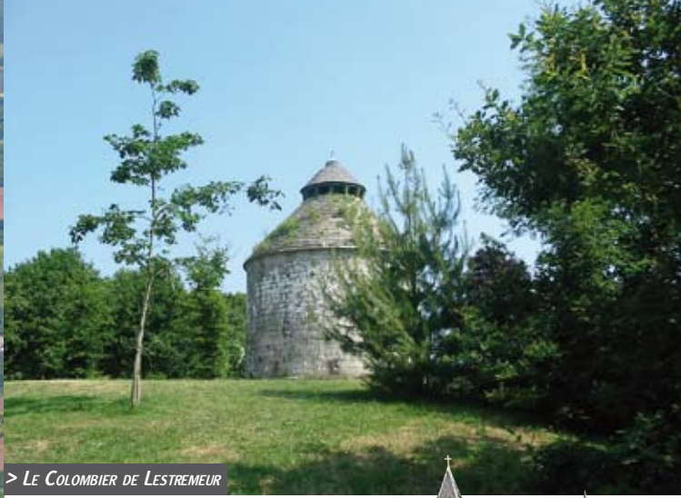
> LE COLOMBIER DE LESTREMEUR

Commune bretonne de plus de 4.000 habitants, PLOMELIN (PLO-VEILH en celtique) est idéalement située sur la rive droite de l'Odet à mi-chemin entre Quimper, capitale de la Cornouaille, ville d'art et d'histoire, et les belles plages de sable fin de Bénodet, de Sainte-Marine et de l'Ile-Tudy.