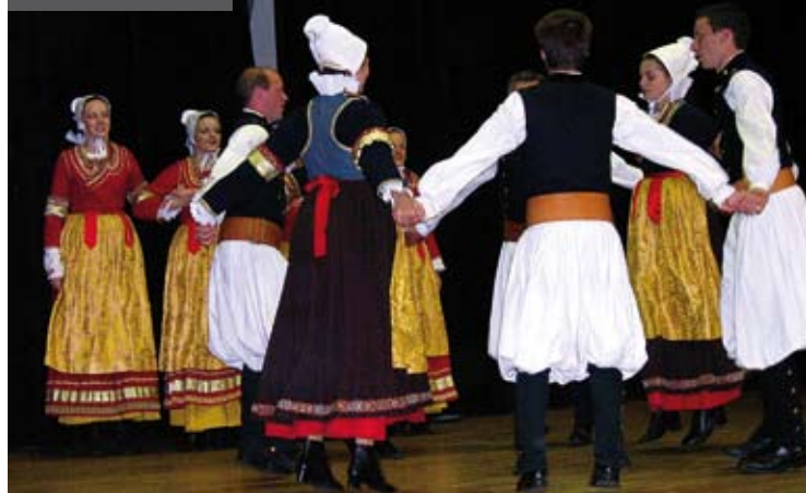
> LE CERCLE DE PLOMELIN

La liste des hébergements est disponible en mairie et à l'Office de Tourisme de Quimper en Cornouaille.