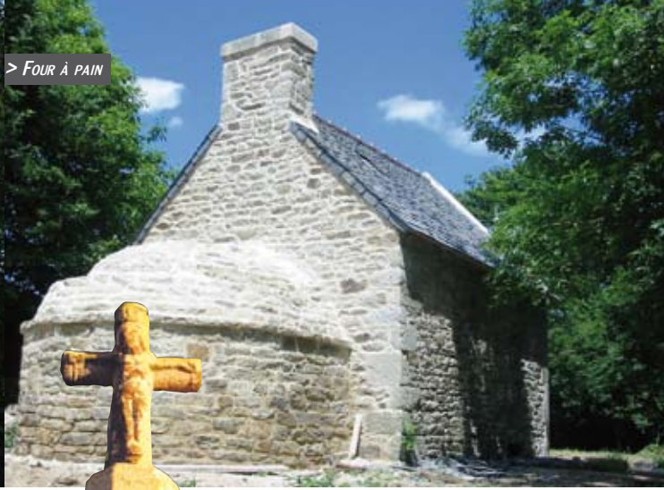
> FOUR À PAIN