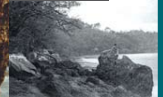
> LA CHAISE DE L'ÉVÊQUE