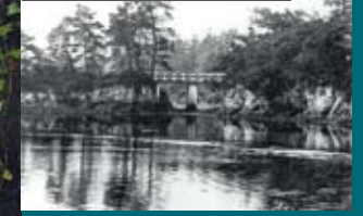
> LA POINTE DES TROIS TOURTES

Une sage jeune fille, poursuivie par un galant très assidu, préféra se jeter dans l'Odet plutôt que de perdre son honneur. Une main surnaturelle (celle de Sainte Barbe) lui fit franchir l'obstacle sans dommages. Le galant sauta à l'eau lui aussi mais trépassa.