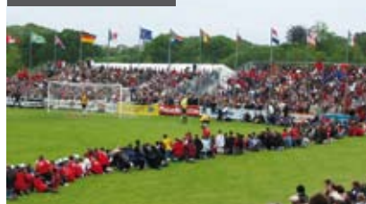
> LE MONDIAL PUPILLES

Toute l'année de nombreuses animations égaillent la vie de la commune. En mars, le Salon Livr'Arts est un rendez-vous incontournable du printemps, suivi par le Mondial Pupilles de football rassemblant plusieurs milliers de joueurs et de spectateurs (week-end de l'Ascension). En été, le pardon de Saint Roch a lieu en août. La fin de l'année est l'occasion de découvrir le marché de Noël de la Gribouille.